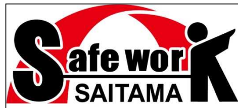
「Safe Work SAITAMA」ロゴマーク